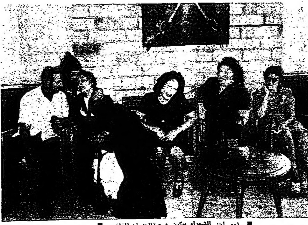
لور احد الشهداء بيكنر ضحية العدوان الفلستيني